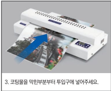
3. 코팅물을 막힌부분부터 투입구에 넣어주세요.