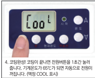
4. 코팅완성! 코팅이 끝나면 전원버튼을 1초간 눌러 줍니다. 기계온도가 65°C가 되면 자동으로 전원이 꺼집니다. (액정 COOL 표시)