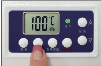
1. 기기 뒷면 전원을 켜 후, 핫버튼을 눌러줍니다. (기본온도 100°C 설정)