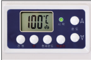
2. 예열이 완료되면 부저음이 3번 울리고 시작등에 녹색불이 들어옵니다.